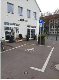
Parkplatz für Menschen mit Behinderungen

Wir haben für Sie einige Fotos aus dem Betrieb / Angebot zusammengestellt. In den Detailberichten finden Sie weitere Fotos.