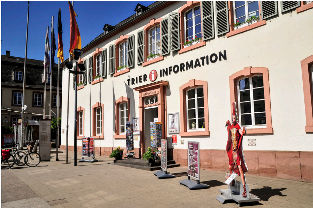
Trier Tourismus und Marketing